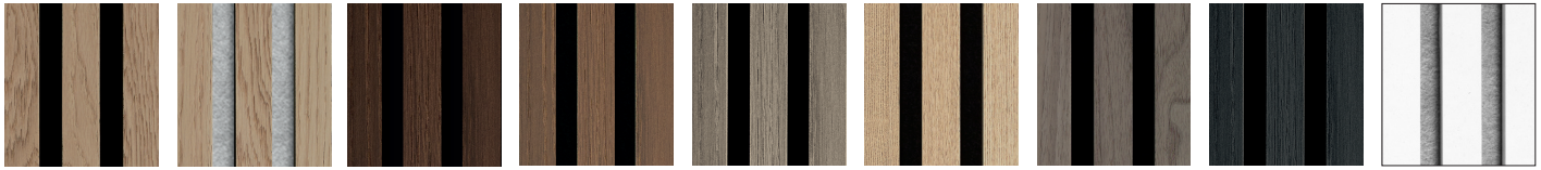
Carvalho claro Carvalho claro/cinz. Carvalho fumado Carvalho oleado Carvalho cinza Freixo Nogueira Carvalho-negral Platina e branco