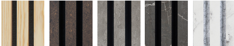
Nature Oak Rusty Concrete Pattern Marble White